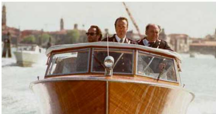
Commissario Brunetti: Bei Donna Leon liegen literarischer und geografischer Raum nah beieinander

Ob in einer Kurzgeschichte, in einem Drama oder Roman: Jede