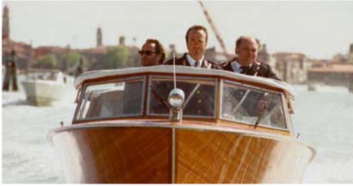
Commissario Brunetti: Bei Donna Leon liegen literarischer und geografischer Raum nah beieinander